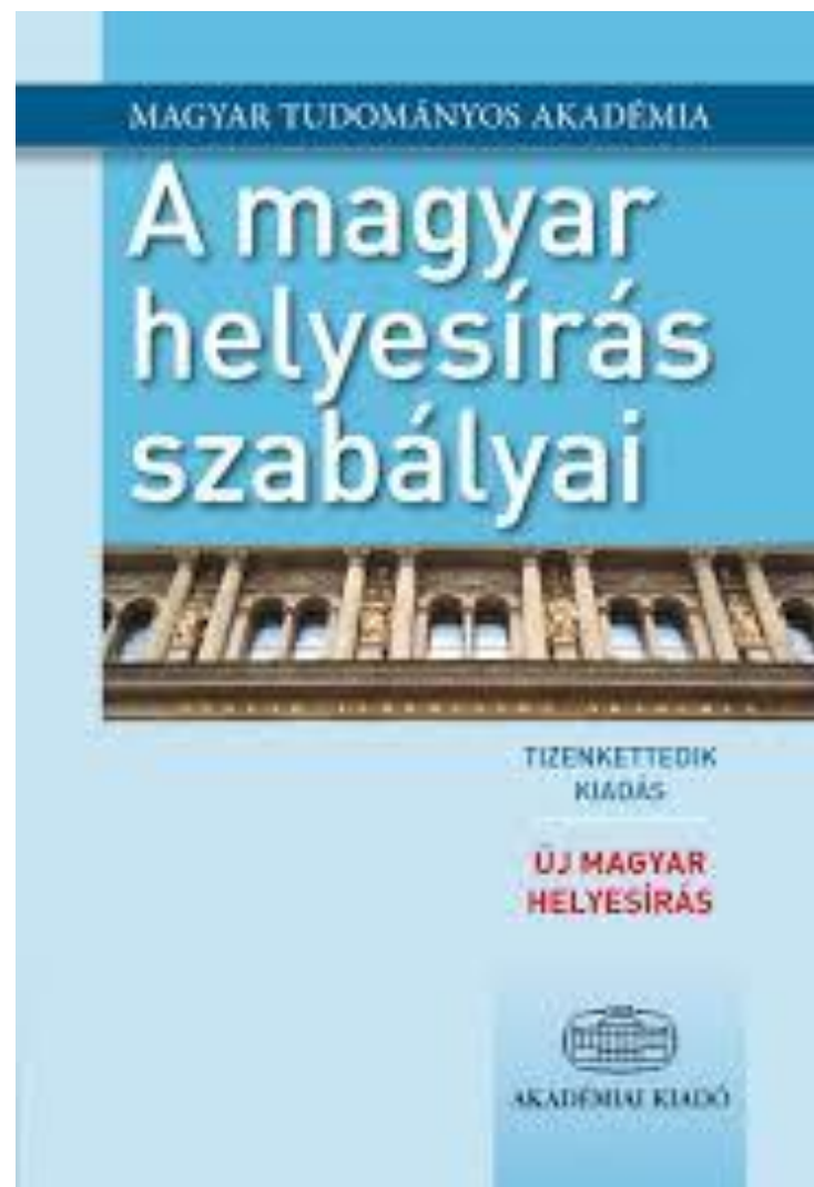
A magyar helyesírás szabályai, tizenkettedik kiadás, 2015